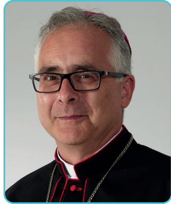
† Antonio José Valín Valdés Obispo de Tui-Vigo

Con el paso de los años nos vamos haciendo miles de preguntas. Entre estas, cómo plantearnos la vida, qué hacer en este mundo que nos toca vivir, de qué manera... y hay que reconocer que no es fácil dar una respuesta. Como seguidores de Jesús, aquel que nos provoca y cuestiona siempre, esas preguntas se plantean de muchas maneras: Pedro, ¿me amas? ; Venid en pos de mí y os haré pescadores de hombres ; Sígueme... en todas, la iniciativa siempre viene de Jesús que nos invita a estar con él y a seguirlo.